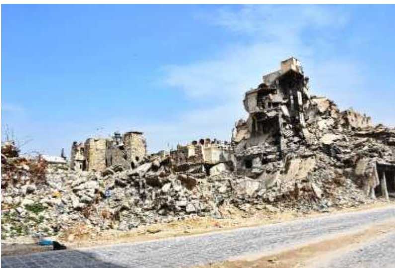
Zerstörte Gebäude in Aleppo

Unsere Aufmerksamkeit hat immer enge Grenzen. Wir können ja kaum den Krieg, Corona und den Klimawandel zusammen bedenken. Eines drängt sich in den Vordergrund und das Andere fällt hinten rüber. Die Ukraine hat das Thema Krieg immerhin wieder zu uns gebracht. Aber Krieg gab und gibt es immer an irgendwelchen Stellen dieser Erde. Und die sind schon lange in Vergessenheit geraten, nachdem wir ihnen kurz Aufmerksamkeit geschenkt haben.