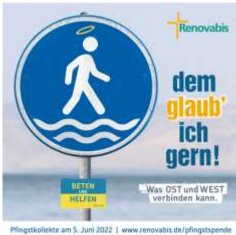
Pfingstkollekte am 5. Juni 2022 | www.renovabis.de/pfingstspende

Mit dem Leitwort „ dem glaub' ich gern! Was Ost und West verbinden kann “ knüpft die Renovabis-Pfingstaktion im Jahr 2022 an frühere Aktionen an, in denen die weltkirchliche Lern- und Glaubensgemeinschaft und der Dialog zwischen Ost und West in den Blick genommen wurden.