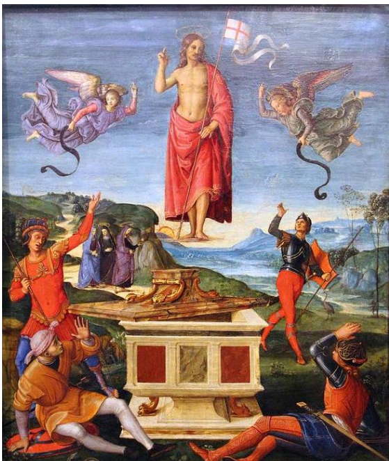
Raffael Santi, Auferstehung Christi